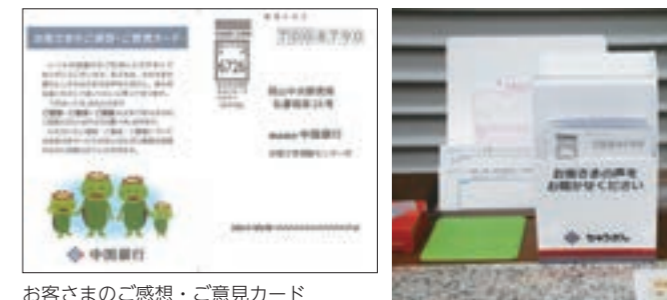
お客さまのご感想・ご意見カード

店頭へ「お客さまのご感想・ご意見カード」を設置し、お客さまからいただく貴重なご意見を、サービス品質向上に役立てています。