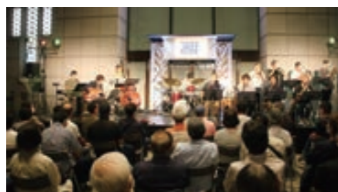
ちゅうぎんまえジャズナイト2022