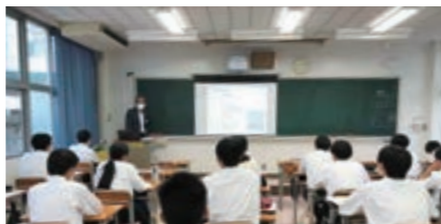
岡山県立真庭高等学校での出張授業

青少年のスポーツ支援として「ちゅうぎんカップ岡山少年サッカー5年生大会」の特別協賛などをおこなっています。