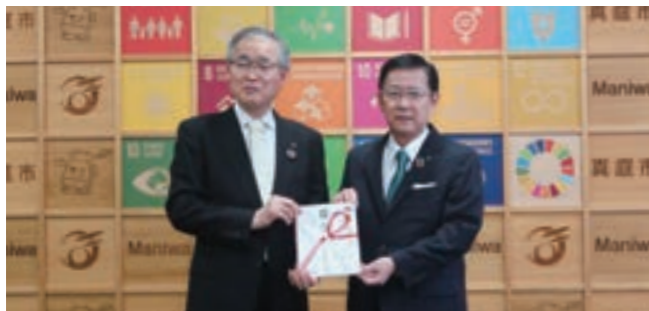
ちゅうぎんの森 寄附金贈呈式

2022年度には真庭市と「地方創生SDGsに係る包括連携協力に関する協定書」を締結し、深刻化する環境問題などの課題解決への取り組みを開始したほか、本年度より「ちゅうぎんの森」支援区域を19haに拡大のうえ新たに支援することといたしました。